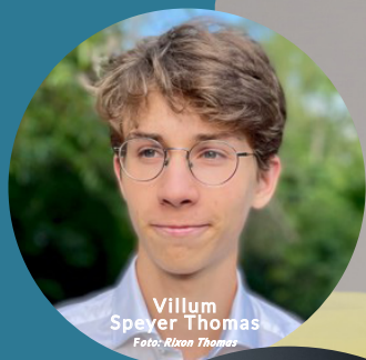
Villum Speyer Thomas